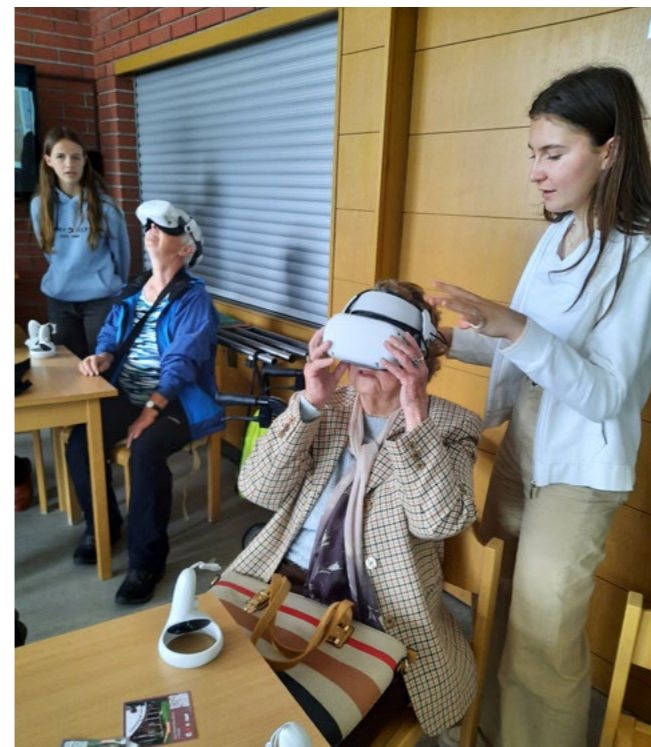
Virtuální realitu studenti přiblížili také seniorům.

https://www.climaterules.com/cs/metodiky-projektu-social-impact-of-climate-rules/