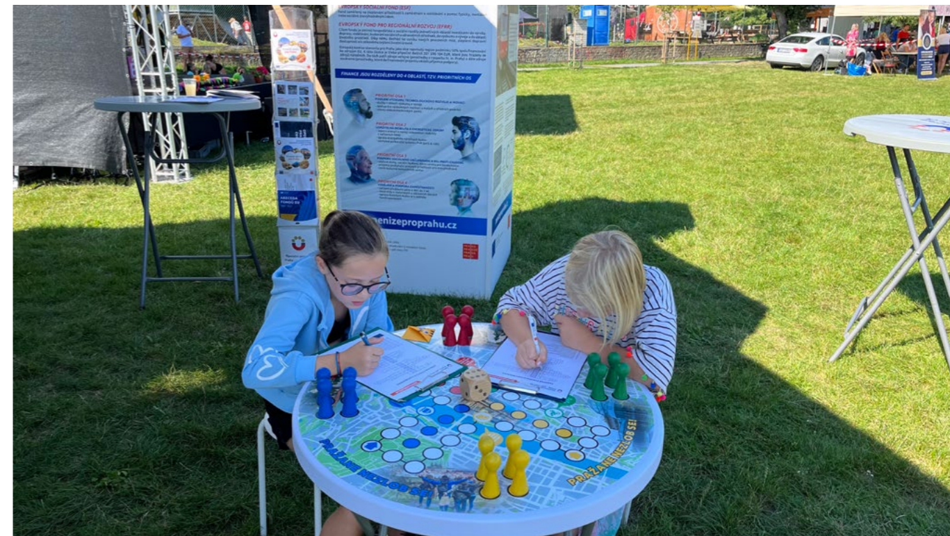
Hru Pražane, nezlob se s obřími figurkami si rádi zahrají malí i velcí.

Velkému zájmu návštěvníků se těšila také akce, která se za krásného počasí uskutečnila ve čtvrtek 7. září na pláni před oborou Hvězda na Vypichu. Centrum zábavy a sportu, spadající pod Dům dětí a mládeže Prahy 6, zde prezentovalo své kroužky a kurzy, a to s bohatým doprovodným programem. Nechyběla obří nafukovací atrakce, malování