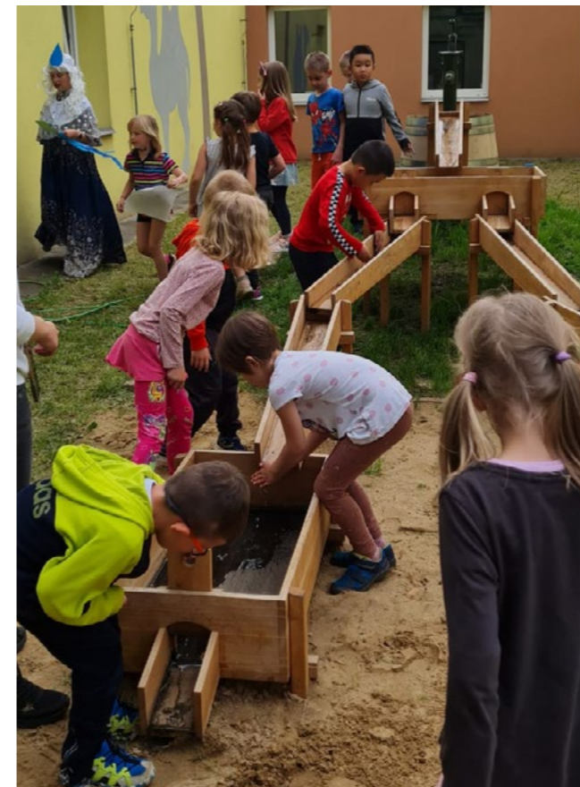
Vodní svět děti současně baví i učí.

V současnosti navštěvuje toto zařízení v Čechtické ulici ve dvanácté pražské městské části bezmála 150 dětí, včetně mnoha dětí s odlišným mateřským jazykem a dětí se zvláštními vzdělávacími potřebami. Školka klade důraz na jejich vzdělávání i oblasti ochrany životního prostředí, donedávna ji však v tomto