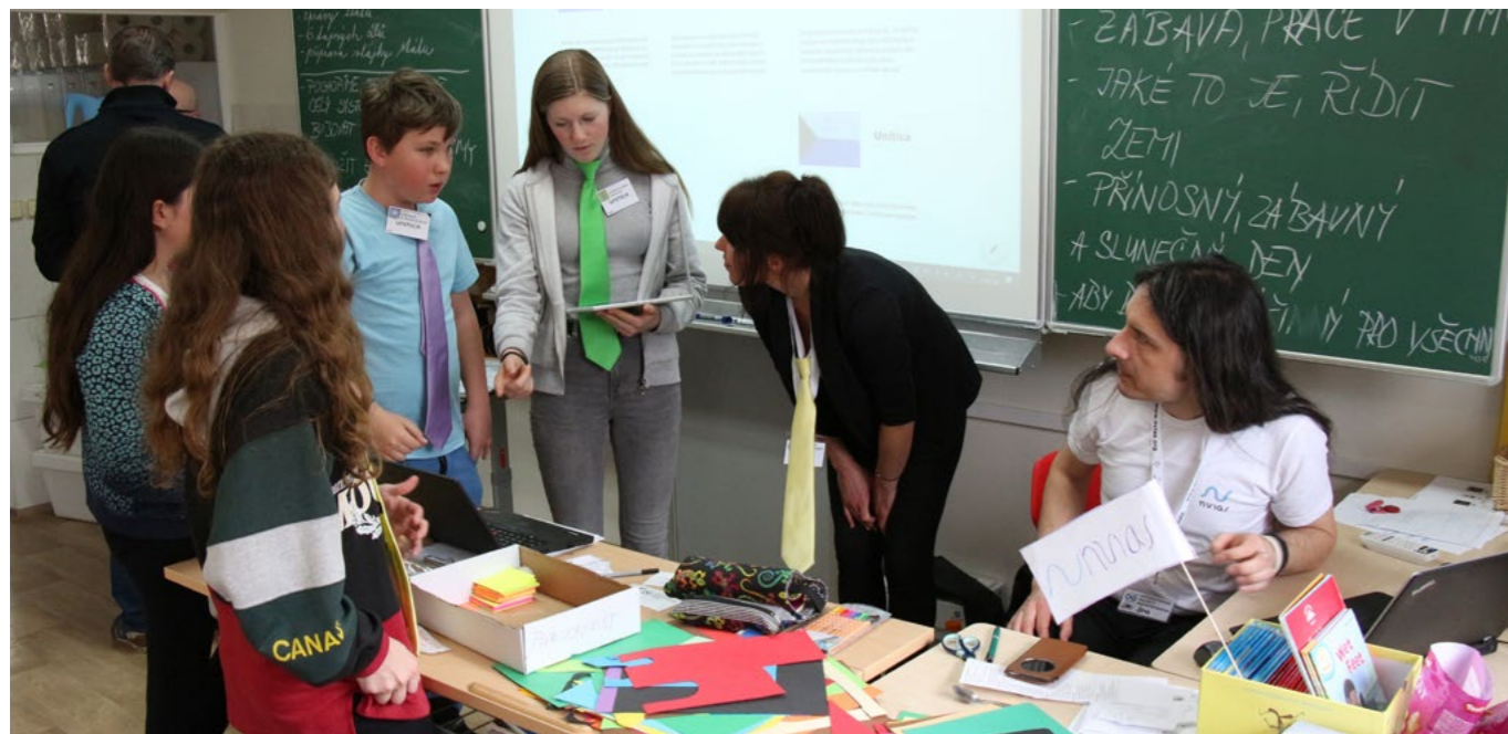
Do projektu se zapojili i žáci posledních dvou ročníků základních škol.

Experti se proto zaměřili na vývoj vzdělávacího programu, umožňujícího pochopit problematiku chudoby, nezaměstnanosti, sociální nerovnosti, diskriminace či klimatických změn komplexně, a to na místní i celosvětové