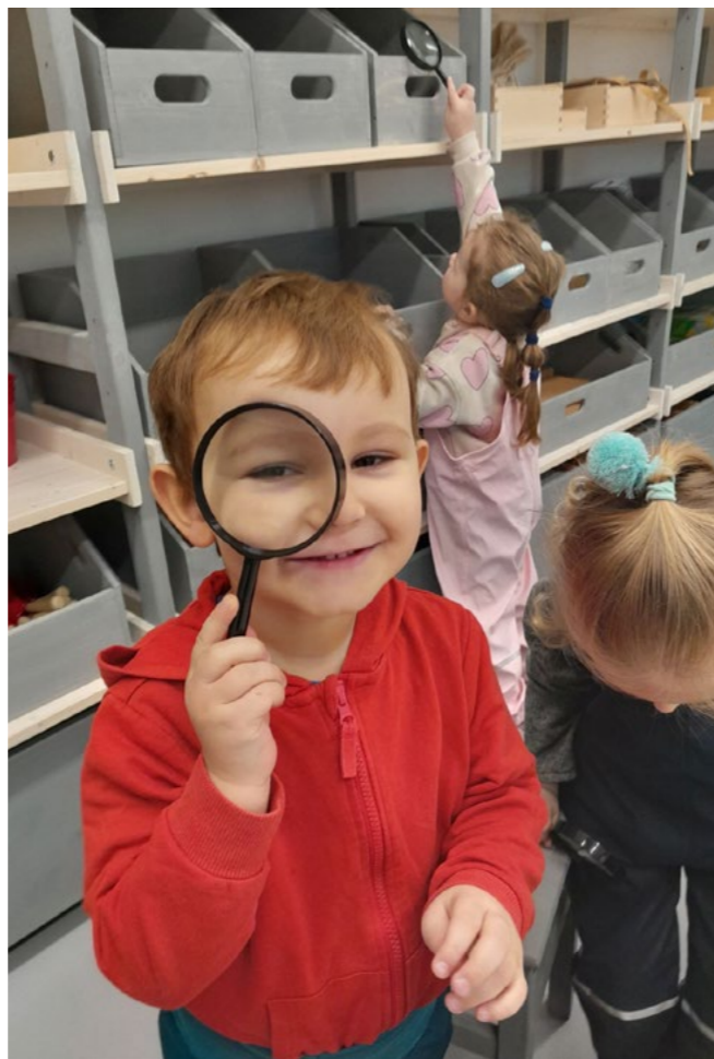
Kluci i děvčátka v ní teď objevují přírodní zákonitosti.