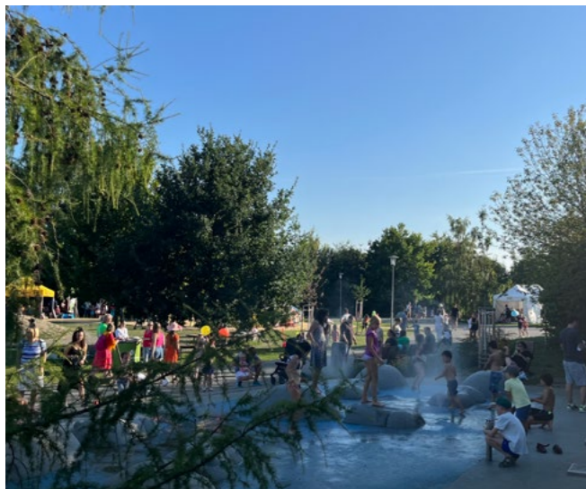
Horké počasí děti využily k vodním hrátkám.

Na návštěvníky čekal ve zdejším zábavním parku pestrý program, na míru ušitý těm, komu byl určen, tedy dětem. Pro ně tu byly připraveny soutěže, tanec, ale také třeba skákání na nafukovacích atrakcích a setkání se zajímavými hosty. Mezi nimi nechyběli Michal Nesvadba či formace Maxim Turbulenc, kteří ovládli pódium. Počasí akci více než přálo, teploty atakovaly rekordy, takže mnoho dětí s nadšením využilo příležitost osvěžit se na novém hřišti vodní mlhou.