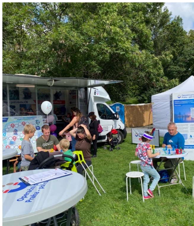
Mobilní stánek lákal návštěvníky akce v parku Podviní...

Také vás letošní mimořádně teplé září zlávalo k návštěvě akcí pořádaných pod širým nebem? Pokud vaše volba padla na události konané na zelených plochách deváté, šesté nebo třinácté pražské městské části, možná jsme se potkali u stánku pražského operačního programu.