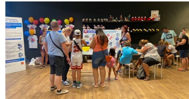
Klimatizovaný prostor příchozí vítali.

Ti, kteří se o programu chtěli dozvědět víc, se pak v objektu přesunuli jen o kousek dál. Obchodní centrum Galerie Butovice totiž až do konce září hostí putovní výstavu úspěšných projektů podpořených z tohoto programu.