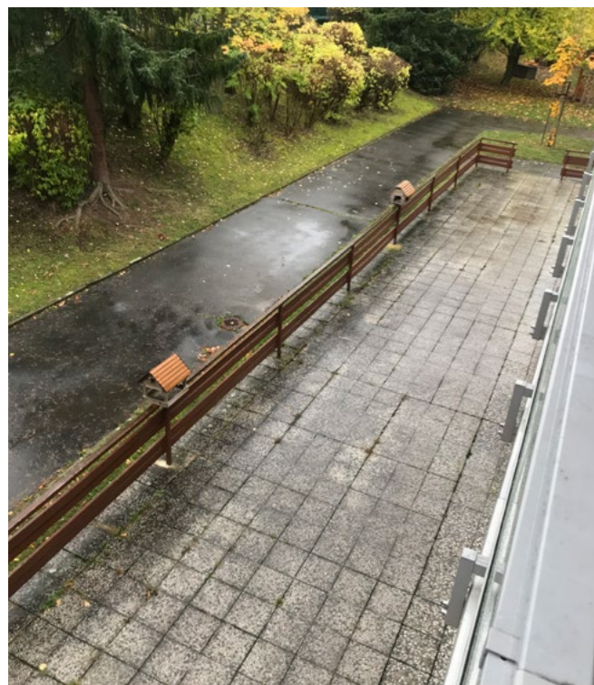
Takto to před pavilony vypadalo před úpravami...

Zásadní proměnou prošla díky podpoře z pražského operačního programu Mateřská škola Oáza v pražském Kamýku. Po úpravě jednoho z jejích čtyř objektů a vytvoření nových tříd přišla na řadu modernizace zahrady a vytvoření polytechnické učebny.