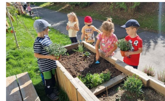
...a v září těmi podzimními.