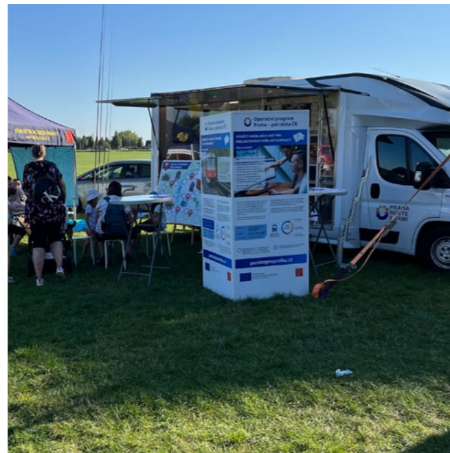
...i na Vypichu.

První zářijovou sobotu jsme s naší bílou dodávkou vyrazili do vysočanského parku Podviní, kde se konal již sedmý ročník festivalu Barevná devítka. Nabízených řemeslných aktivit, občerstvení z různých koutů světa a hudebních produkcí si sem přicházely užít jak rodiny s dětmi, tak i páry a skupiny přátel. Mnozí zamířili k našemu stánku a využili možnost zahrát si s dětmi populární hru Pražane, nezlob se. Když byly herní stoly obsazeny, prověřili své znalosti ve velkoplošné hře Hraj Prahu!