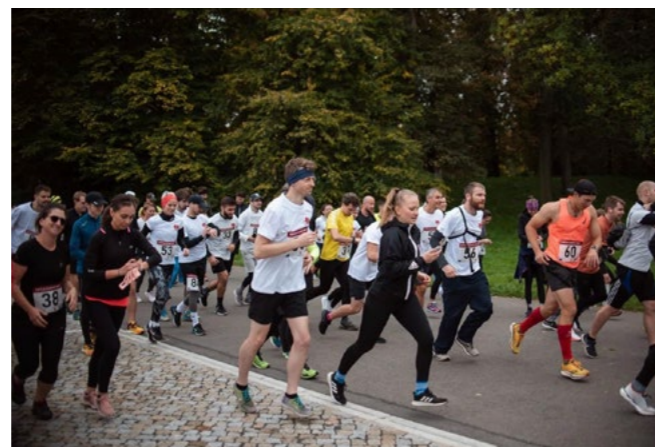
Zájem o běh ve Stromovce každým rokem roste.

O výtěžek běhu se i letos motolská klinika podělí s onkologickými pacienty vinohradské nemocnice. Vybraná částka opět podpoří rekonvalescenci nemocných dětí i dospělých, která je pro jejich zotavení velmi důležitá. Pokud tedy máte za měsíc možnost a chuť, velmi rádi se s vámi setkáme na startu!