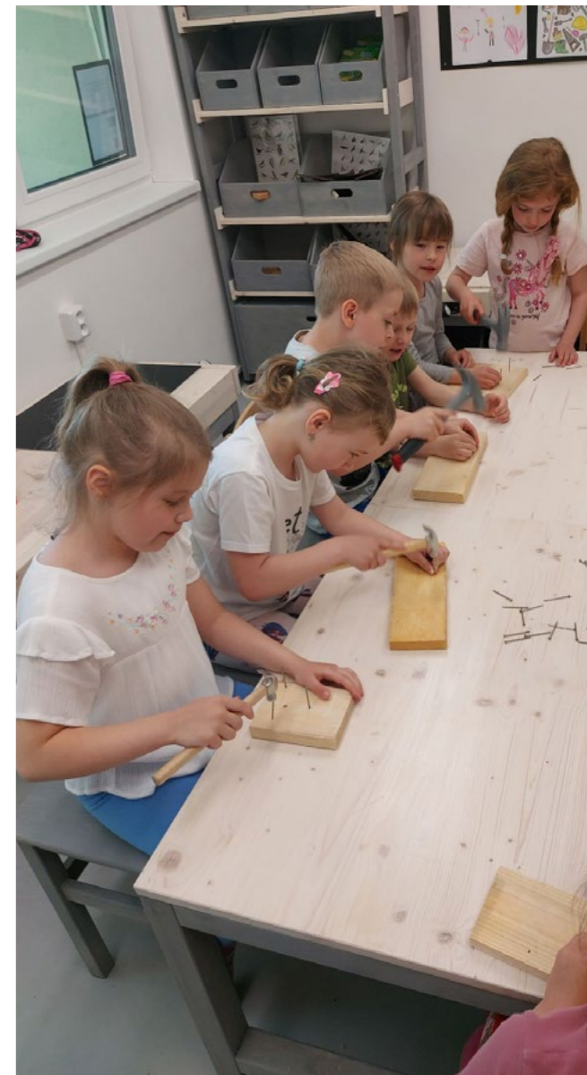
Přírodniny zde nejen zkoumají, ale také z nich tvoří.