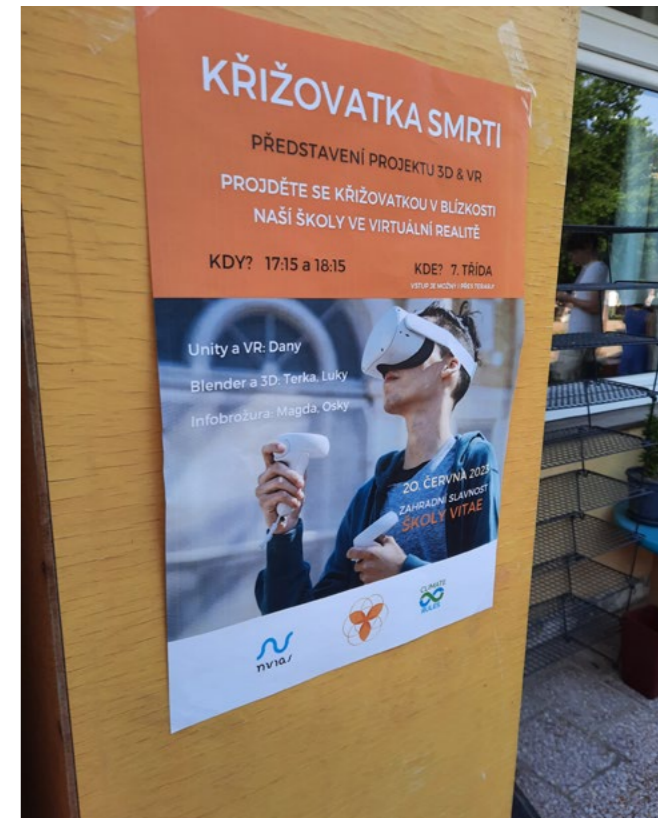
Cílem jednoho z projektů bylo zlepšit bezpečnost u školy.