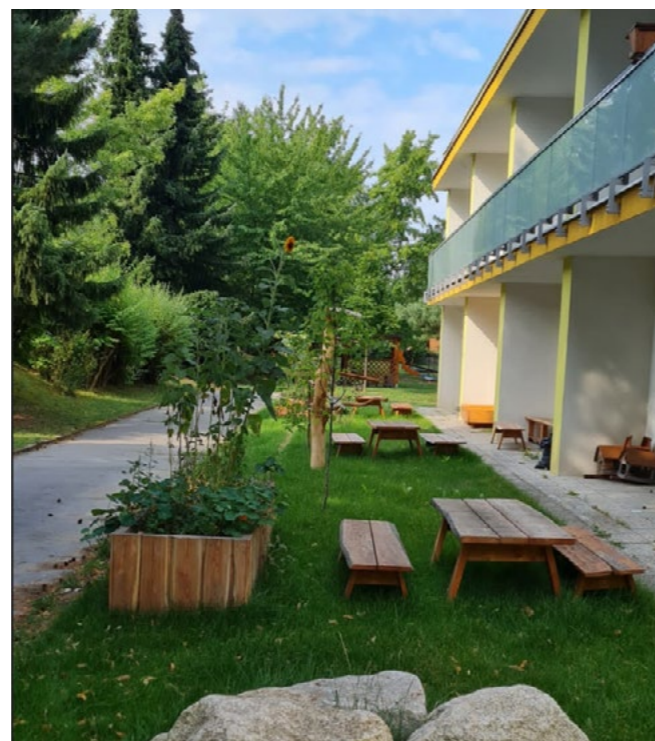
...a takto to vypadá nyní.

Projekt, díky němuž se kapacita MŠ Oáza zvýšila ze čtyř na šest tříd, jsme vám představili v jarním vydání bulletinu. Nyní vás pozveme na návštěvu této školky znovu. Zdejší pedagogy, ale i rodiče totiž mluví o tom, že po dokončení druhého podpořeného projektu mateřinka plně odpovídá svému názvu, tedy že je skutečně přívětivou a klidnou oázou.