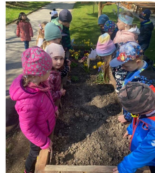
V dubnu děti nové truhlíky osázely jarními květinami...

směru limitovalo nedostatečné vybavení a chybějící prostory. Značnou část rovinaté, téměř 7,5 tisíce metrů čtverečních velké zahrady totiž zabíraly nevhodné či zastaralé prvky. Místo přímo volalo po modernizaci, po úpravách v přírodním stylu, podněcujících přirozené učení při hře, do níž se může zapojit i zvědavost a fantazie. Uskutečnit vše zmíněné umožnila dotace z pražského operačního programu.