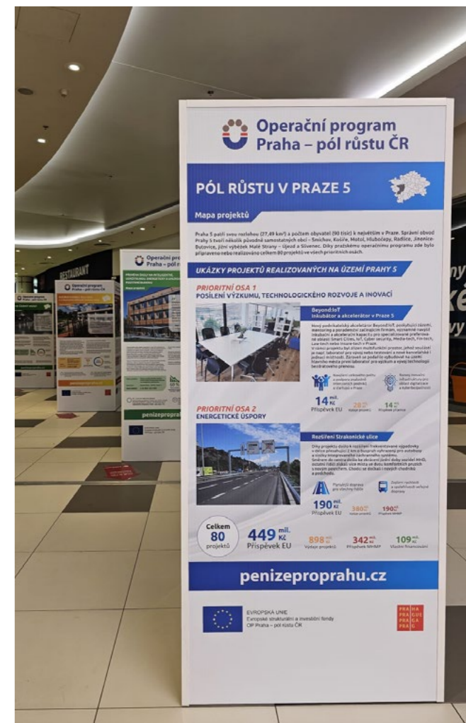
Výstavu projektů lze navštívit do konce září.