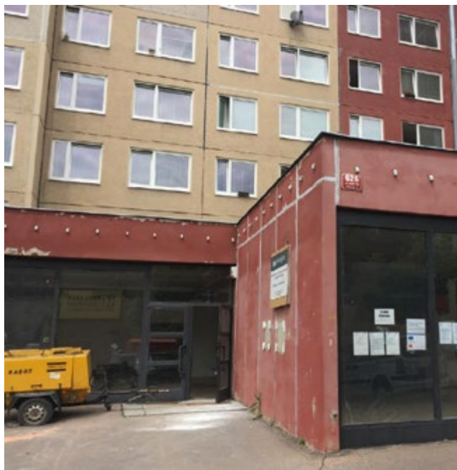
Takto to na místě vypadalo dříve...

D obrý nápad, promyšlený, rychlý a pečlivě kontrovaný postup prací a velké nasazení všech zapojených - díky tomuto všemu dohromady se za pouhých pět měsíců podařilo proměnit chátrající opuštěný prostor v panelovém domě uprostřed sídliště Lehovec v životem kypící centrum celé oblasti. Většinu prostředků nezbytných na jeho vytvoření a provoz zajistila podpora z pražského operačního programu.