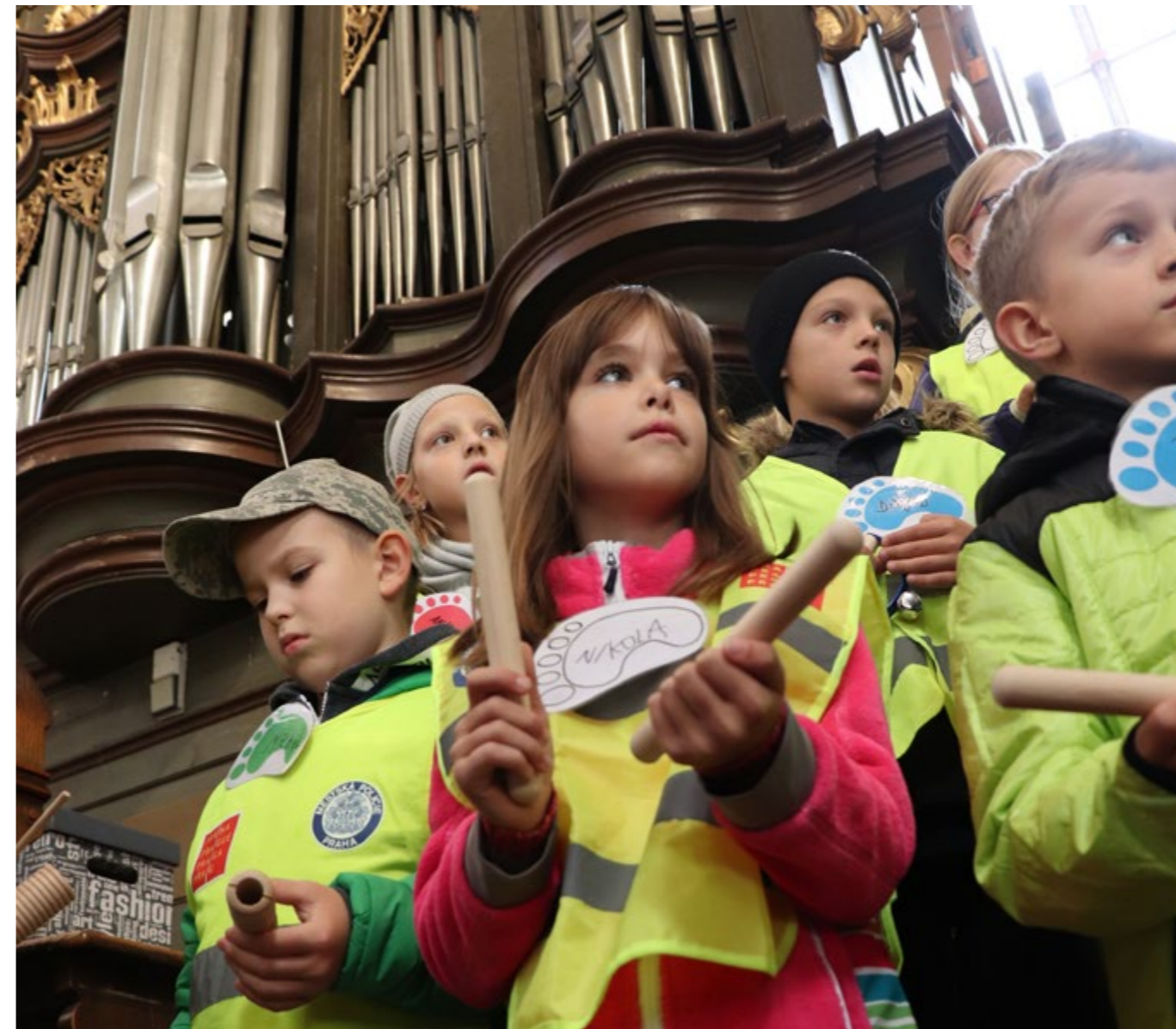
Většina dětí slavnou památku navštívila poprvé.