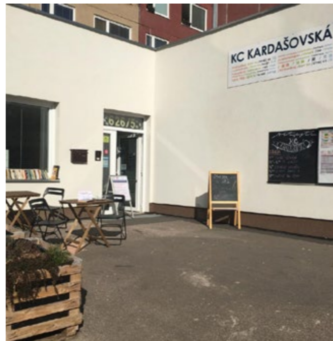
...a takto nyní.

Lehovec je malé uzavřené sídliště se základní a mateřskou školou, které donedávna nenabízelo téměř žádnou příležitost pro trávení volného času. Před pár lety zavřela i jediná místní hospůdka. Část zdejších obecních bytů je využívána pro sociální bydlení, žije tu početná komunita Romů, přičemž řada místních obyvatel má jen minimální vzdělání a potýká se s chudobou, dluhy či nezaměstnaností.