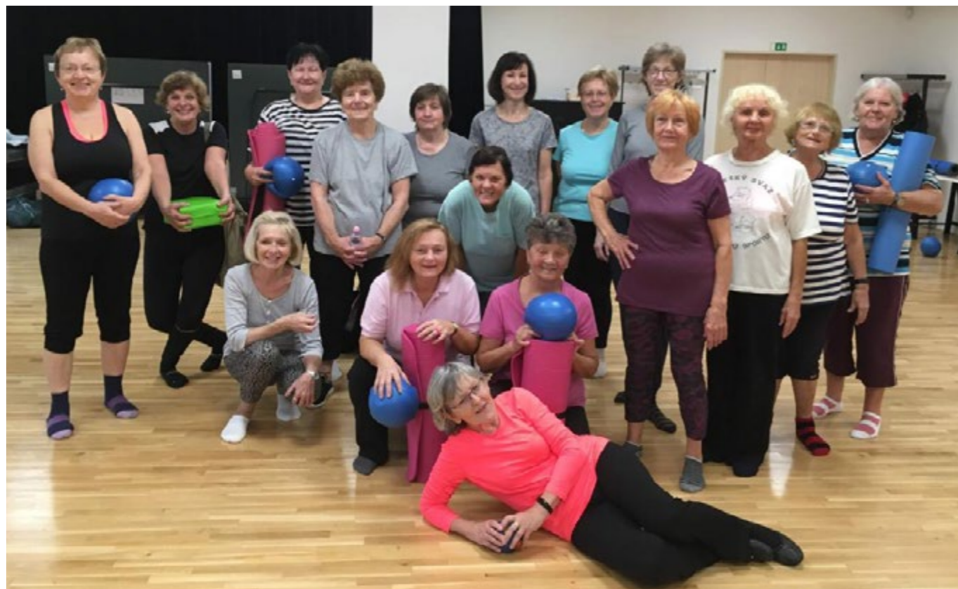
Centrum nabízí pohybové aktivity pro všechny generace.

Radnice proto před třemi lety požádala o dotaci na projekt přestavby prázdného a chátrajícího prostoru v panelovém domě v Kardašovské ulici na komunitní centrum, které by lidem z okolí nabídlo potřebné služby. Rekonstrukce začala v květnu 2017 a první návštěvníky centrum přivítalo již o pět měsíců později. Vznikl zde sál, učebna, herna, kuchyňský kout a samozřejmě sociální zařízení, šatny a další potřebné zázemí.