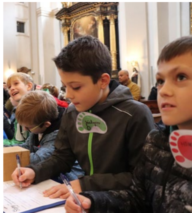
Do programu se zapojilo více než tisíc pražských školáků.

Zájem škol i konkrétní podoba projektu byla v roce 2016 ověřena prostřednictvím pilotního projektu, do kterého se zapojilo osm tříd různých pražských základních škol. Členy tehdejšího týmu, který se stal i základem týmu realizujícího větší projekt, byli kromě jiných především zkušení pedagogové 1. stupně základních škol a lektori takových organizací, jako je Junák či Ymca Familia.