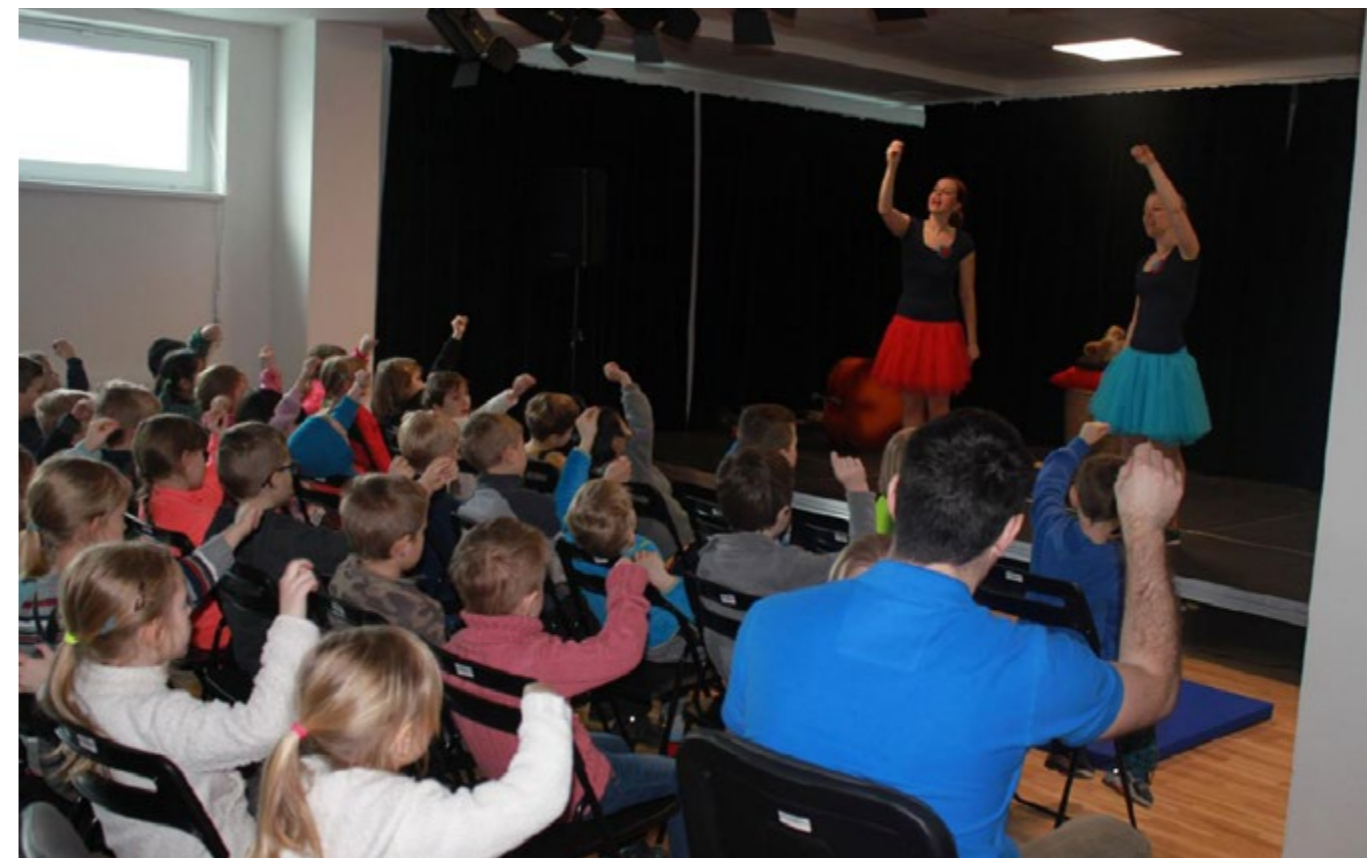
Spektrum činností určených pro děti je velmi široké.

logopedie, příprava na školu, tanec, zpěv, výtvarné aktivity) i pro dospělé (hoop dance, kurzy českého jazyka pro cizince, vzdělávací semináře). Centrum pořádá také cestopisné besedy spojené s komunitním vařením, oblíbené jsou sobotní kreativní dílny, workshopy v komunitní zahrádce či divadelní představení. Velký zájem je také o právní a odborné poradenství, které zahrnuje mj. oblast financí, zaměstnání či bydlení. Aktivity centra zajišťují jeho pracovníci a externí lektori.