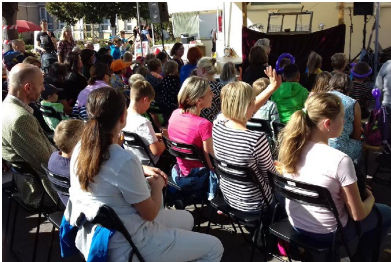
Velký zájem vyvolal i letošní druhý ročník sousedské slavnosti nazvané Zažit Kardašovskou jinak.