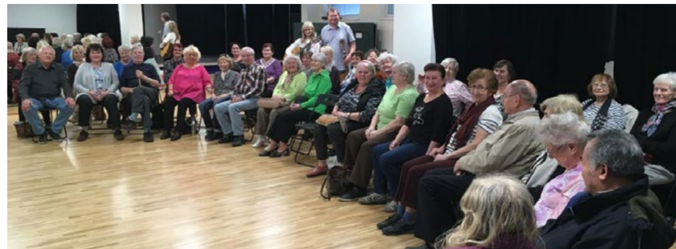
Bezmála polovinu klientů centra tvoří senioři.