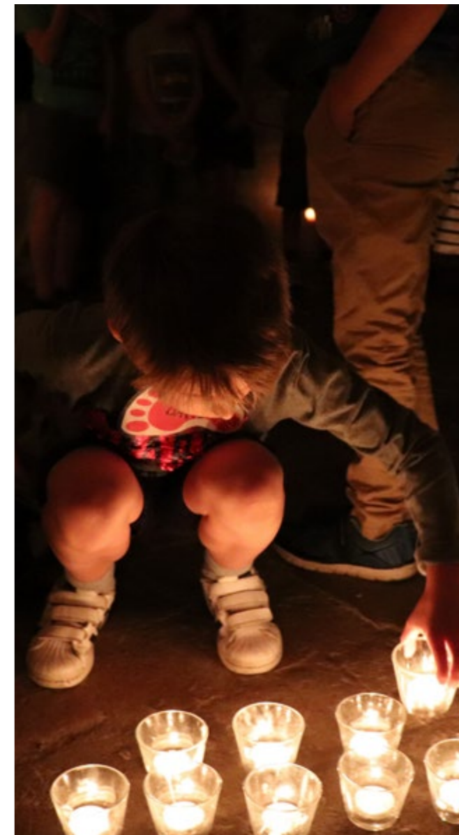
Chybět nesmělo ani světlo svíček.