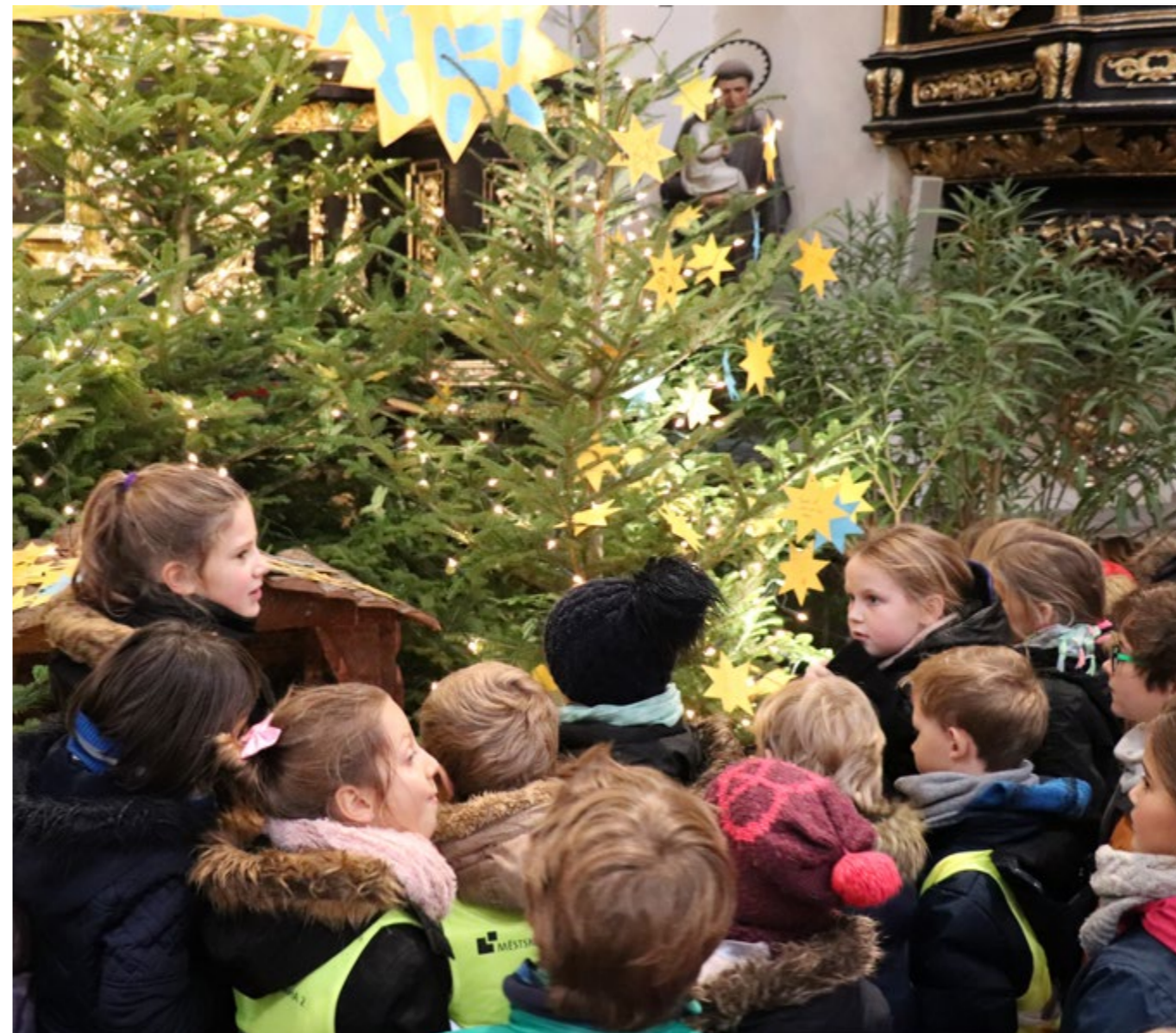
Vánoční výzdoba v kostele se dětem líbila.