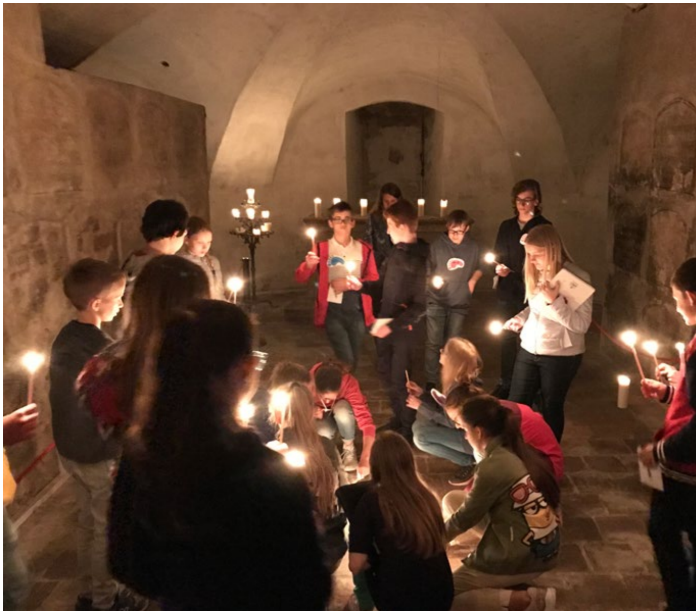
Pro děti se otevřela i krypta, chór a klášter.