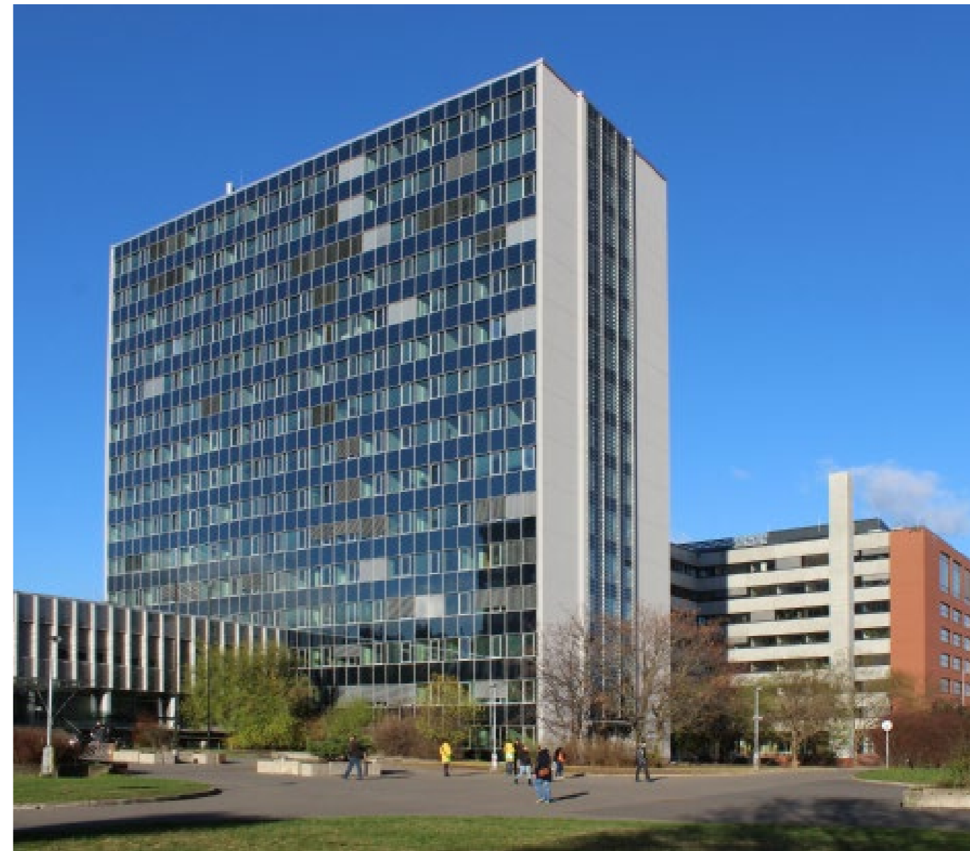
ČVUT vyvinula řadu potřebných technických zařízení.