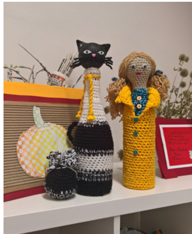
Ženy v komunitním centru se věnují i výtvarné činnosti.

V denním centru v Žitné ulici číslo 35 najdou ženy každý všední den kromě prvního čtvrtku v měsíci od 7:00 do 12:30 nejen bezpečné prostředí pro odpočinek, ale také poradnu. Za symbolický poplatek se tu mohou osprchovat, vyprat si prádlo či získat nové, dát si čaj, kávu nebo polévku.