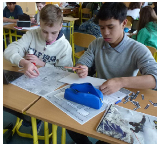
Do běžné výuky se díky projektu mohou postupně plně zapojit i děti cizinců.

Cílem projektu je také připravit ostatní žáky školy na život v multikulturní společnosti a poznáváním odlišných kulturních a společenských zvyklostí jiných národů je vést k toleranci