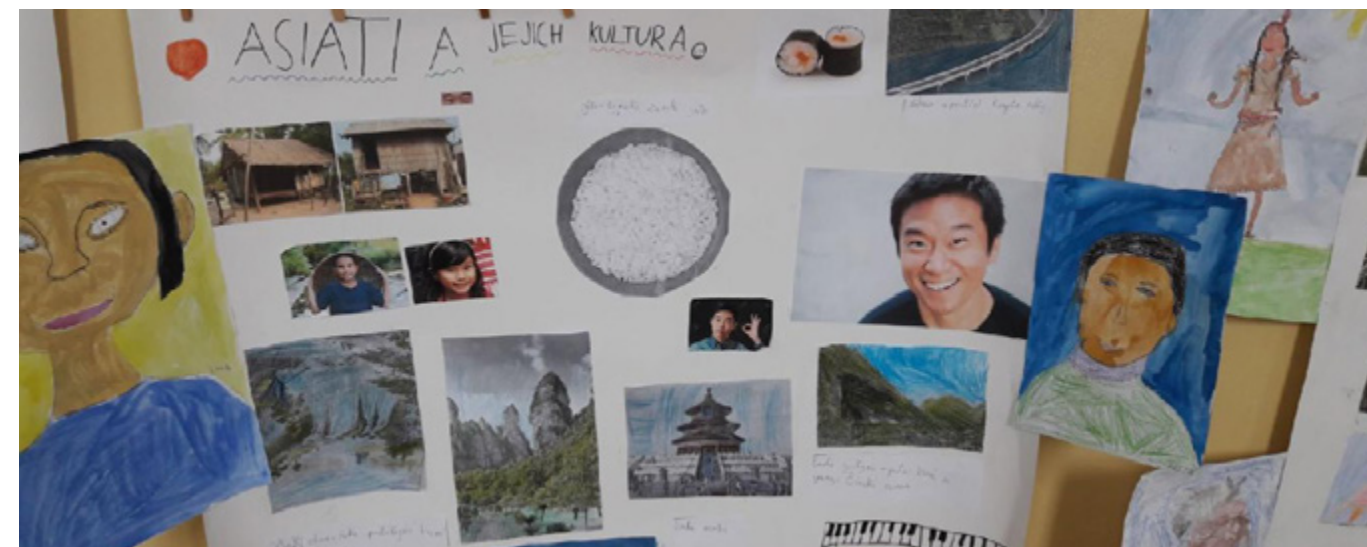
Společná práce na projektu přináší dětem nové poznatky a učí je toleranci.

a odmítání projevů rasismu a xenofobie. „Děti například porovnávaly zvyky v různých zemích, zajímaly se o země svých spolužáků, učily se v zážitkových aktivitách respektovat odlišnosti. Spolupracovaly také s metodičkou na materiálech, které jsme pro děti s odlišným mateřským jazykem připravili, zkoušely si i roli tutorů,“ poznamenala ředitelka školy.