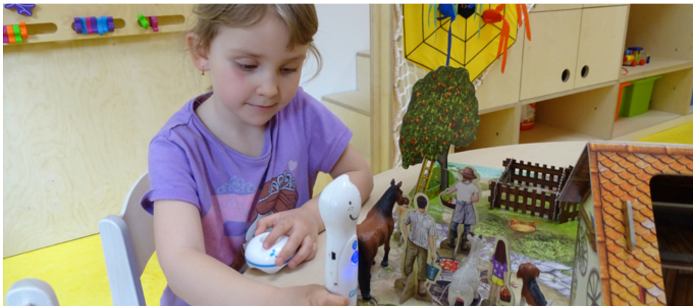
Děti jsou v péči "tet" velmi spokojené.