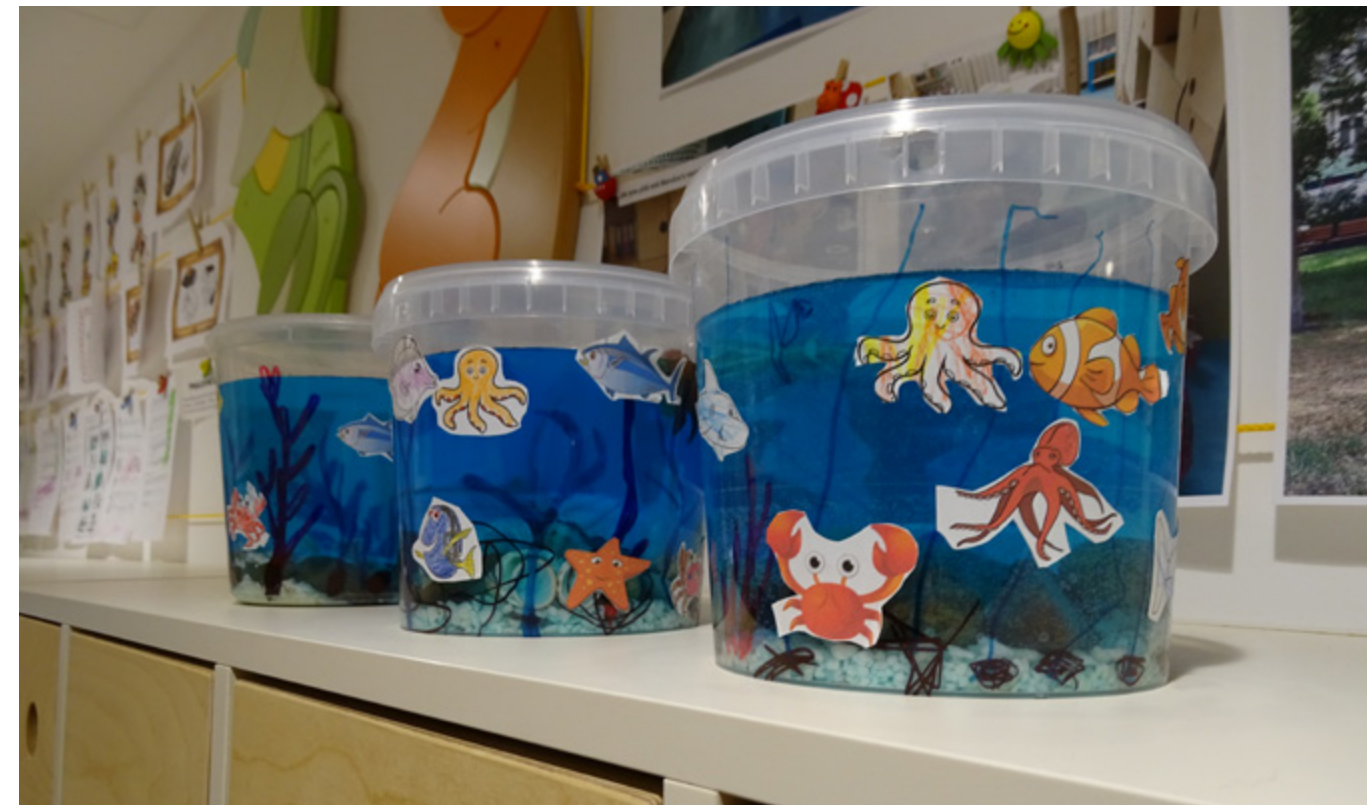
Děti vytvářely i "mořský svět".

Zájem o umístění dětí do dětských skupin sice stoupá, volná místa však ještě jsou. Podmínkou přijetí je především pracovní právní vztah rodiče k pražskému magistrátu, věk dítěte mezi dvěma lety a zahájením povinné školní docházky a očkování dle aktuálního očkovacího kalendáře.