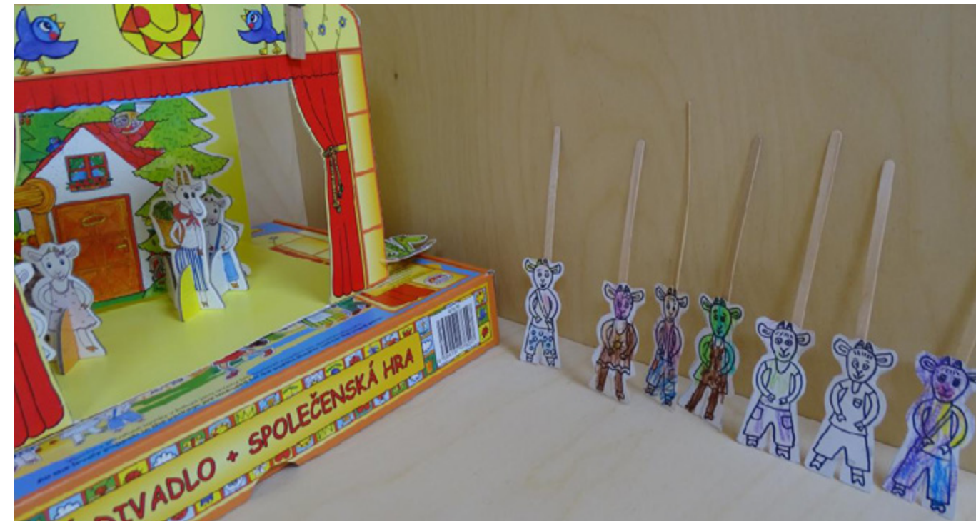
Vybarvit postavičku do divadélka zvládly i nejmenší děti.

Dětské skupiny sídlí v prvním patře paláce TeTa, přímo proti úřední budově magistrátu ve Škodově paláci. „Rodiče to k nám mají jen přes ulici a dokonce se mohou pohledem z okna přesvědčit, že jejich dítě je u nás opravdu spokojené,“ řekla Andrea Hájková. Každou skupinu mají na starosti dvě „tety“, které hladce a s úsměvem zvládají kompletní, takřka mateřskou péči, počínaje výměnou plenek u nejmenších dětí, přes didaktický program, procházky, stolování či odpolední spánek. Každá skupina má k dispozici vlastní místnost vybavenou vším potřebným a umývárnu. Počet pravidelně docházejících dětí zatím umožňuje používat jednu místnost jako denní hernu a jídelnu a druhou jako ložnici.