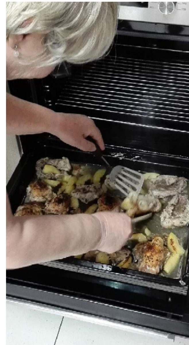
Jednou z aktivit je i společné vaření a stolování.

Upozornila také na nízký zájem veřejnosti. „Všeobecně platí, že zájem o neziskový sektor a charitativní projekty stoupá, bohužel se ve většině případů omezuje na vyklizení skříní s nepotřebnými věcmi, v lepším případě na donesení potřebných potravin nebo