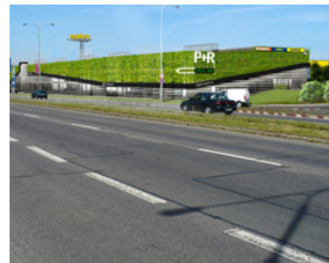
Vizualizace budoucího parkovacího domu.

Parkovací dům na Černém Mostě bude kapacitně největší v Praze - nabídne zhruba o 200 stání více než stávající P+R Letňany nebo P+R Chodov. Vznikne za výjezdem z komunikace R1 ze směru od Mladé Boleslavi a Hradce Králové poblíž nákupního centra Černý Most a obchodních domů Makro, Hornbach a Sconto. Objekt nahradí jedno ze dvou současných pozemních záchytných parkovišť, jehož kapacita je ovšem oproti plánovanému domu třetinová. Na okolní komunikace, autobusové zastávky a stanici metra Černý Most bude objekt napojen bezbariérově upravenou nadzemní lávkou přes Chlumeckou ulici.