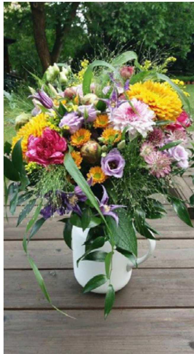
Květinářky Aranžerie jsou skutečně zručné.

Květinářky ze Společnosti E začaly první květinové vazby a dekorace tvořit před deseti lety, zpočátku svépomocí, pod vedením aranžérky. Když o pár let později zkusily své výrobky prodávat, byl o ně zájem, což vedlo k založení sociálního podniku nazvaného Aranžerie – květiny od lidí s epilepsií.