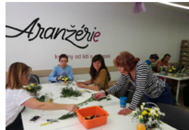
Květinové dekorace a vazby vznikají s úsměvem.

O práci v Aranžerii má zájem více potřebných lidí, než může podnik zaměstnat. Dotace z pražského operačního programu loni umožnila zaměstnat tři pracovníce na plný úvazek (z toho dvě maminky dětí s epilepsií) a zhruba deseti dalším úvazek navýšit. Produkce květinářství se díky tomu zdvojnásobila