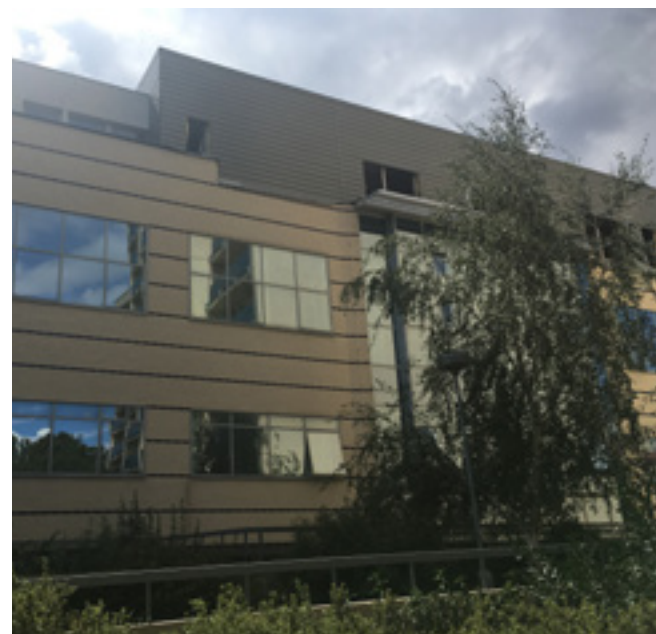
Současná podoba budovy.

„xPORT VŠE je univerzitní inkubátor, který pomáhá zejména ambiciózním studentům a absolventům VŠE na cestě od inovativního nápadu k úspěšně prosperujícímu businessu. Za tři roky fungování mělo více než 170 projektů zájem stát se součástí