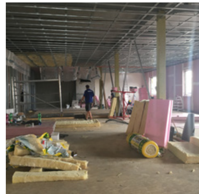
Stavební práce jdou již do finále.

Schválený projekt umožnil vytvořit na nižší části objektu školy nástavbu, rekonstruovat původní prostory a oba celky propojit a vybavit novým nábytkem a technikou. Původní prostory xPORTu se nově rozrostly o 528 metrů čtverečních.